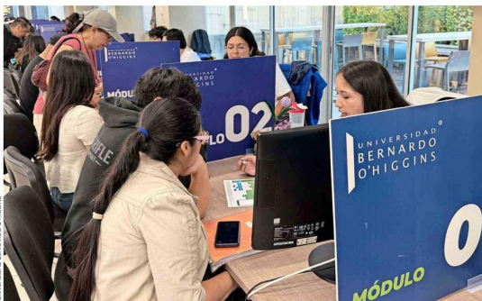
Durante el proceso 2026, la UBO fortaleció una estrategia de acompañamiento integral, que combinó atención presencial, canales digitales como una feria en metaverso, un agente con inteligencia artificial para la atención web y orientación personalizada.

“La UBO combina calidad académica con un fuerte foco en el acompañamiento académico, vocacional y socioemocional. Además, estudiar en una universidad adscrita a gratuidad, con carreras acreditadas y altos estándares formativos, resulta un factor decisivo para estudiantes y familias”, sostiene la directora