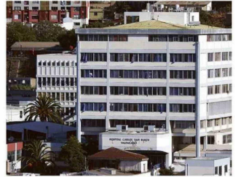
INFRAESTRUCTURA DEL RECINTO ES HOY INSUFICIENTE.

3 meses, aproximadamente, han pasado desde que el SSVSA anunció que estaba ad portas de firmar compra.