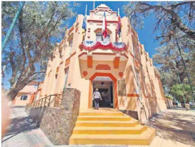
CONCEJALES SOLICITAN QUE SE CUMPLA COMPROMISO DE EFECTUAR AUDITORÍAS EXTERNAS EN EL MUNICIPIO.

"Hoy adquiere principal prioridad la ejecución de una auditoría externa, compromiso asumido por el Concejo Municipal durante el año pasado, y que se cumpla con una medida de probidad acordada por