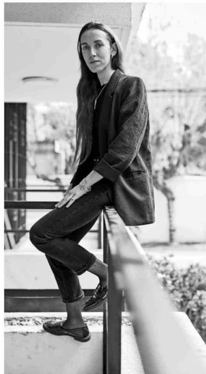
Sus dibujos son detallistas, hechos con lápiz pastel acuarelable, logrando negros muy fuertes; estas obras estarán en el Museo Reina Sofía.

—El hecho de retratar experiencias comunes, como la transformación de los espacios que habitamos o la pérdida de identidad y memoria de esos lugares, es algo universal que no se busca de manera explícita, sino que se da al trabajar desde lo esencial. Más que representar un fenómeno global, creo que mi obra conecta porque todos hemos visto desaparecer un sitio o sentido el paso del tiempo; junto con no querer olvidar nuestra historia y lo que nos ha traído hasta donde estamos —dice @isidoravillarino. VD