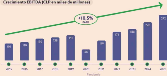
Crecimiento EBITDA (CLP en miles de millones)