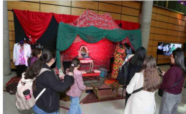
La escenografía de teleseries también provocó interés.

cas sobrenaturales. Estaban supuestamente poseídos por el demonio. Hace 200 años una crisis de epilepsia era vista como un símbolo de posesión diabólica. En este contexto, los locos eran muy mal vistos, pero más todavía las mujeres, a quienes se les aplicaba un tratamiento más