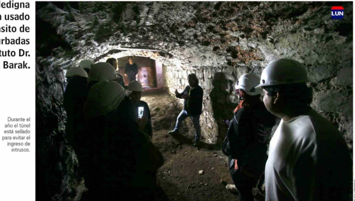
Durante el año el túnel está sellado para evitar el ingreso de intrusos.