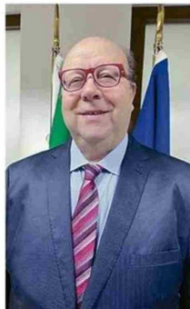
FRANCO DEZEREGA, CÓNsul GENERAL DE ITALIA.

como Argentina y Brasil tuvieron migraciones organizadas y establecidas por los Estados. En nuestro caso fue una inmigración espontánea, generalmente de familias en familia y llegaban muchas veces de la misma Argentina o por el paso de las naves por el Cabo de Hornos hacia el norte, permaneciendo en puertos como Valparaíso o Iquique.