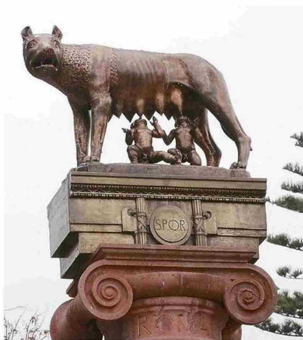
EN EL PARQUE ITALIA ESTÁ UNA ESCULTURA DE LA LOBA CAPITOLINA, QUE AMAMANTÓ A RÓMULO Y REMO, FUNDADORES DE ROMA.

-Giuseppe Garibaldi fue llamado el héroe de los dos mundos, porque en una etapa de su vida se comprometió con guerras de liberación e independencia en Brasil y Uruguay principalmente. Su visita y participación en movimientos libertarios en América se ha estudiado y existen muchas referencias en la historiografía sobre su presencia en este continente. Sin embargo, de la visita que realiza entre marzo y abril de 1853 a nuestras costas, específicamente Viña del Mar y Valparaíso, se posee poca información y corresponde exclusivamente a su paso en el bergantín Carmen que provenía que provenía del Perú y a su participación en conmemoraciones y reconocimientos a su persona por parte de los italianos