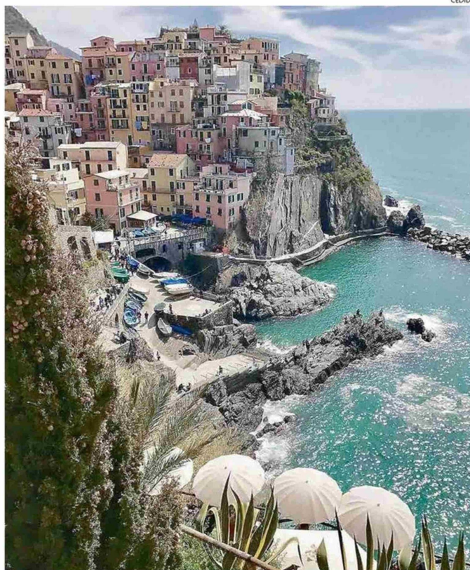
PARTE IMPORTANTE DE LA MIGRACIÓN ITALIANA PROVIENE DE LA REGIÓN DE LIGURIA.

del siglo XVIII, ya que 1836 ya había un consulado del reino de Piemonte y Cerdeña. Pero la gran llegada de italianos a este puerto se produjo en varias etapas que coincidie-