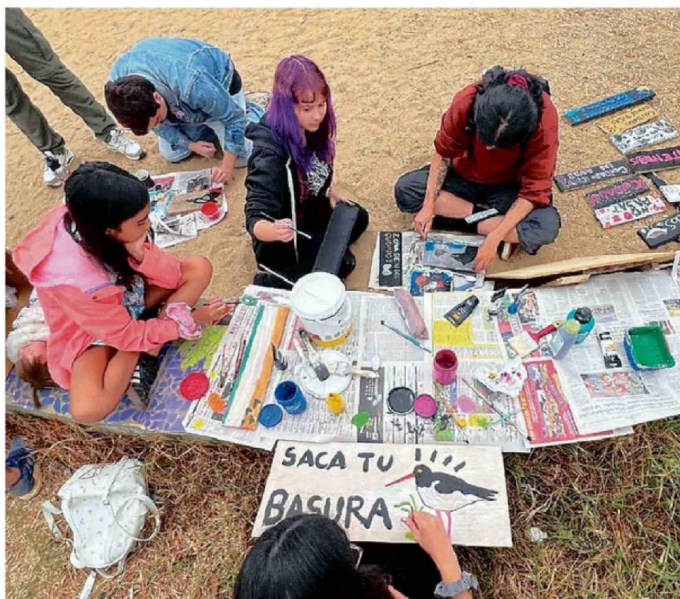
LA CAMPAÑA ES IMPULSADA POR LA AGRUPACIÓN OJO CON LAS PLAYERAS.

Saavedra también puso el acento en el uso doméstico de este elemento y en la falta de lugares donde muchas personas puedan dejarlo de forma segura. “Nace como una idea muy buena para darle la posibilidad a vecinas y vecinos de poder disponer de estos residuos en lugares que