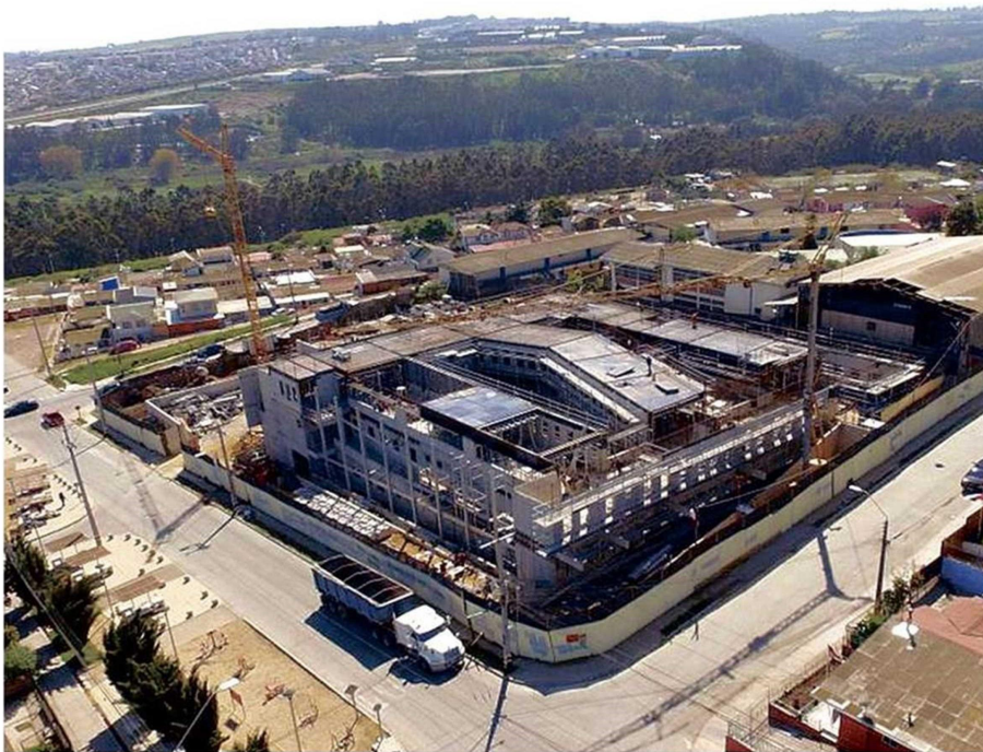
EL NUEVO CESFAM DE LLOLEO ESTARÁ OPERATIVO DENTRO DE ESTE AÑO.

Consultada por la preocupación por la falta de especialistas, expuso que “tenemos que hacer todo lo posible para hacer de