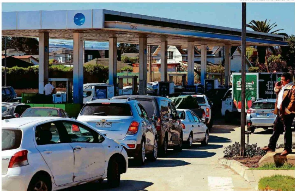
LOS CONDUCTORES SE AGOLPARON EN LAS ESTACIONES DE SERVICIO PARA LLENAR SUS ESTANQUES ANTES DEL INCREMENTO DEL PRECIO.

Frente a este escenario, los colectiveros de San Antonio ya tomaron una decisión: subirán sus tari-