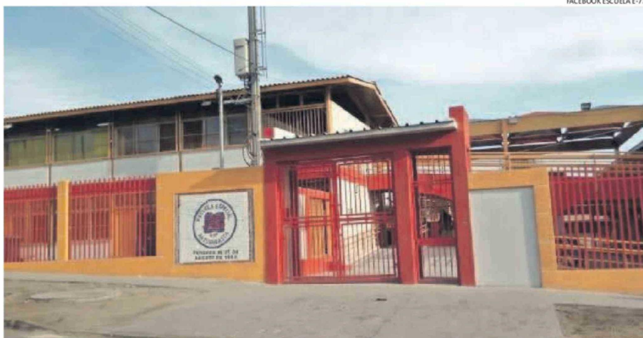
LA ESCUELA ESPECIAL E-77 JUAN SANDOVAL CARRASCO ESTÁ UBICADA EN CALLE GENERAL BORGÑO.

Además, es parte de la banda de cumbia "Los Mercury" y desde el municipio indicaron que ha realizado un aporte invaluable al desarrollo de la música, el folclore y la formación artística escolar, siendo profesor de artes musicales, formador de coros, monitor de actividades extraescolares y promotor permanente de la expresión cultural co-