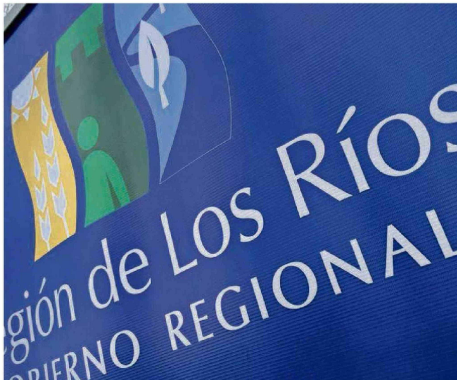
GOBIERNO REGIONAL ESTÁ REALIZANDO GESTIONES, JUNTO CON ANCORE, AGORECHI Y SENADOR IVÁN FLORES PARA REVERTIR SITUACIÓN.

Agregó que "pasamos el año en estas circunstancias, durante noviembre y diciembre con una deuda de arrastre sobre los 10 mil millones de pesos y, por lo tanto, cuando solicitamos en enero los recursos, estábamos solicitando esa deuda de arrastre más 4 mil millones de pesos del gasto comprometido en el mes de enero. Eso da una suma sobre los 14 mil millones de pesos. Nos han depositado sobre los 7 mil millones de pesos y, por lo tanto, estamos con una deuda de arrastre cer-