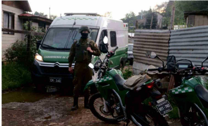
ENTRE LAS INTERVENCIONES SE INCLUYE UN MAYOR RESGUARDO POLICIAL EN LAS ÁREAS MÁS COMPLEJAS.

surgieron en el llamado "estallido social" de 2019, de las cuales el plan considera la intervención integral sólo de dos ubicadas en Rahue Alto, incluyendo la temida "Folilche".