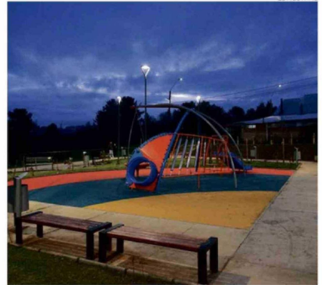
TAMBIÉN CONSIDERA RECUPERAR ESPACIOS PARA PLAZAS Y PARQUES.

alta connotación pública (como un crimen en la toma 'Folilche' en 2025) además de incautaciones de drogas que han sido inéditas en el sur de Chile. Uno de los casos más recientes corresponde a un operativo conjunto entre la Fiscalía de Osorno y Carabineros, que permitió la detención de una banda extranjera dedicada al tráfico de drogas de alta peligrosidad", afirmó.