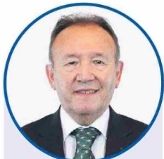
José García Ruminot

SEGPRES: Militante RN. Contador público y auditor. Actualmente, es senador por la 15.ª Circunscripción Sur, Región de La Araucanía. Ejerció como presidente del Senado, entre el 19 de marzo de 2024 y el 26 de marzo de 2025.