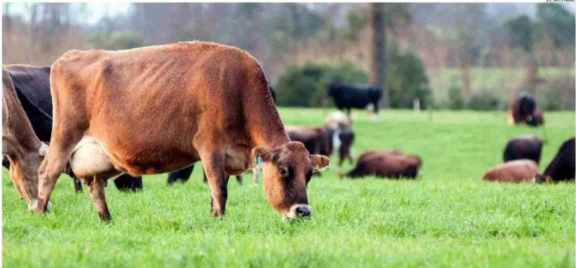
LA LECHE QUE SE PRODUCE EN LA REGIÓN DE LOS LAGOS ES DE ALTA CALIDAD A NIVEL MUNDIAL, YA QUE LAS VACAS SE ALIMENTAN EN BASE A PRADERAS Y A LA INTEMPERIE.

En lo que respecta al último tiempo y a los desafíos del sector, el análisis sobre la situación lechera en Chile durante la última década, que realizó la Federación Gremial Nacional de Productores de Leche (Fedeleche), confirma que a pesar del aumento de la recepción en 2024, persiste la concentración de la industria y los desafíos es-