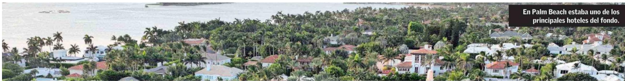
En Palm Beach estaba uno de los principales hoteles del fondo.

Cinco hoteles y una millonaria querrela por “administración desleal”: