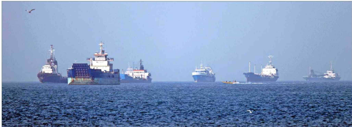
EL ESTRECHO DE ORMUZ vuelve a ser escenario de ataques militares entre Irán y Estados Unidos.

El cruce de ataques se produce tras el comienzo del "Proyecto Libertad" estadounidense que, según información de la agencia EFE, movilizará más de 100 aeronaves, destructores, drones y 15 mil militares por el estrecho de Ormuz para intentar garantizar el cruce de las embarcaciones por el estratégico paso marítimo, por donde transitaba el 20% del petróleo a nivel mundial antes de que comenzara la guerra. La iniciativa de Washington aconseja a los barcos cruzar la vía marítima a través de las