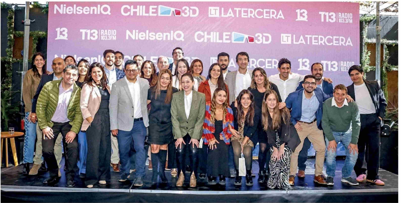
▲ Equipo de NielsenIQ presente en la ceremonia CHILE3D, responsables del estudio que reconoce la preferencia de los consumidores.

Título: Las postales que dejó la emocionante oremiación de CHILE3D