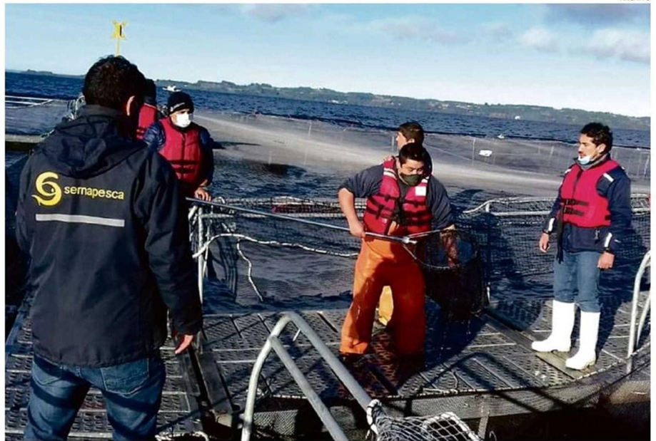
EL PROYECTO ESTIPULA DURAS SANCIONES A LAS EMPRESAS QUE NO PREVENGAN O EVITEN EL ESCAPE DE SALMONES.

En declaraciones en la Cámara Alta, Moreira especificó que "para el caso que se detecte infracciones de seguridad con salmones en la jaula, la multa será el precio del valor cosecha de la mitad de los salmones; si hay escape, será el monto del valor de cosecha de todo lo no recapturado, más la prohibición de funcionamiento