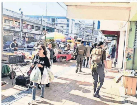
EN TALCAHUANO ASEGURAN QUE HAY Poca DOTACIÓN POLICIAL.

J. Pablo Fariña López cronica@estrellaconce.cl