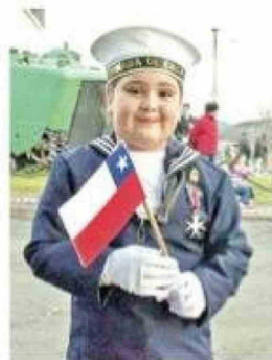
Esta niña se lució con su traje de marinera.