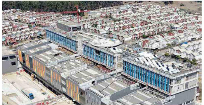
El proyecto, además, incorpora estándares de alto nivel, como certificación de edificio sustentable, aislación sísmica en su estructura principal y autonomía operativa de hasta 72 horas.

el nuevo hospital representa una de las inversiones públicas más relevantes en salud para la región, con un monto total de UF 2.568.510, que considera infraestructura, equipamiento y mobiliario. El recinto alcanzará una superficie de 39.335 metros cuadrados, equivalente a quince veces el tamaño del actual establecimiento, permitiendo ampliar sig-