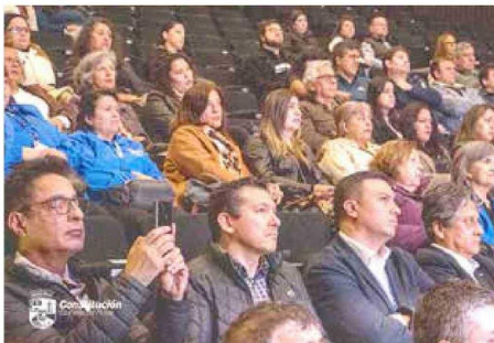
En la actividad participaron autoridades, representantes de organizaciones sociales, dirigentes vecinales, funcionarios de salud y vecinos de la comuna.

miento contará con 111 camas de hospitalización, distribuidas en áreas médico-quirúrgicas adulto y pediátrica, gineco-obstétrica y una Unidad Hospitalaria de Cuidados Intensivos de Psiquiatría, incorporando además nuevas prestaciones como diálisis, hospitalización de día y mayor capacidad de atención en urgencias y especialidades.