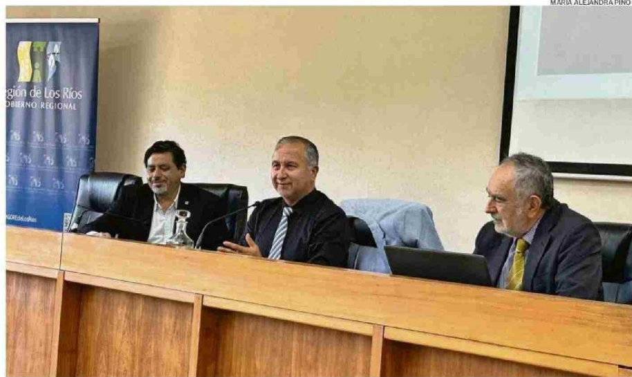
PANEL DE LA AGRUPACIÓN DE UNIVERSIDADES REGIONALES FUE PARTE AYER DEL ENCUENTRO DE CONSEJEROS REGIONALES.