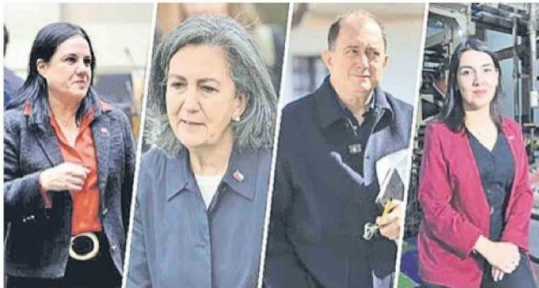
Los ministros de Seguridad, Trinidad Steinert; de Salud, May Chomali; de Vivienda, Iván Poduje; y de la Mujer, Judith Marín.

En tanto, la ministra de Salud, May Chomali, anunció en la comisión de Salud del Senado que el recorte para su cartera bajaría finalmente al 2,5%, luego de una "negociación difícil" con la Dipres y con Quiroz.