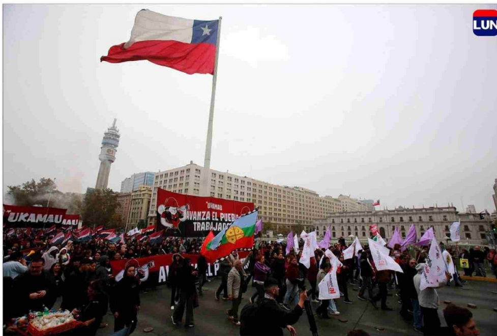
La marcha de la CUT partió a la altura de La Moneda y culminó en Portugal con Alameda.

También a las 10 horas, la Central Clasista de Trabajadoras y Trabajadoras convocó a una marcha que tuvo como punto de inicio la Alameda con calle Brasil y que transitó hacia el