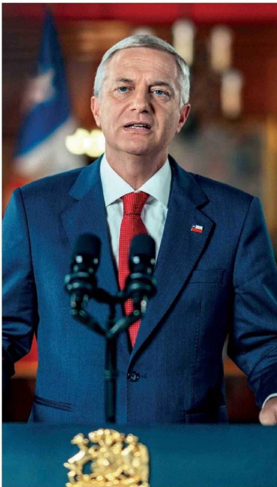
► El Presidente Kast anunció este miércoles detalles de la megarreforma que ingresará la próxima semana.