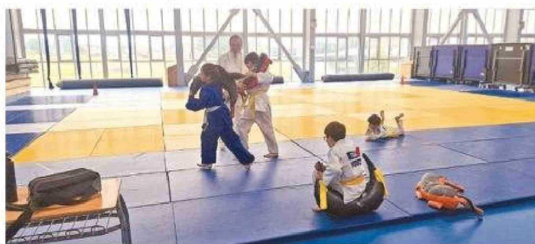
Un aspecto de los entrenamientos realizados.