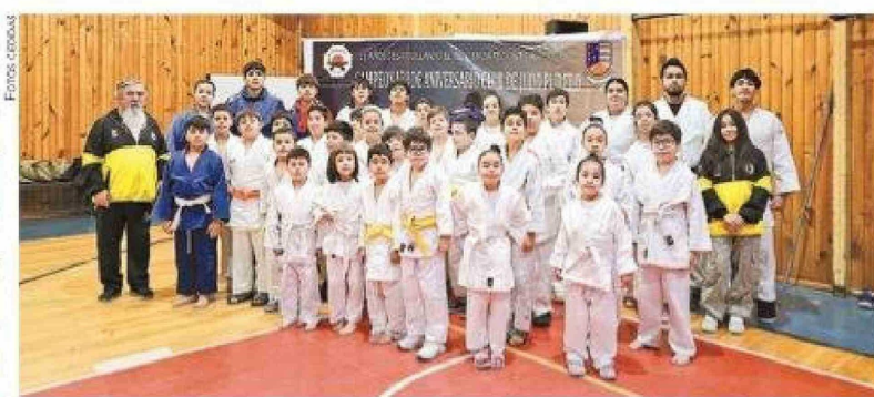
El Club Pudeto cuenta con 104 deportistas inscritos.

Fue precisamente en este contexto de formación y