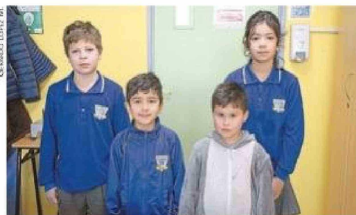
Los cuatro judokas de la Escuela Villa Las Nieves.

a nivel regional, sino que además alcanzaron un nuevo logro al obtener el primer lugar en el Campeonato Nacional de Judo realizado en Santiago.