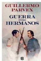
GUERRA ENTRE HERMANOS GUILLERMO PARVEX Ediciones B 296 páginas

Las decisiones de los líderes de la época –sus aciertos y errores– ofrecen material para reflexionar sobre el ejercicio del poder, la responsabilidad y las consecuencias de la intransigencia. La guerra mostró cómo tensiones entre el poder ejecutivo y el Congreso pueden escalar hasta un quiebre total. El lector puede reflexionar sobre la importancia de mantener equilibrios institucionales sólidos y mecanismos de resolución de conflictos. Más allá de la estrategia y la política, la guerra implicó sufrimiento, muertes y fracturas sociales profundas. Esto invita a valorar la estabilidad y la paz como bienes fundamentales. ●