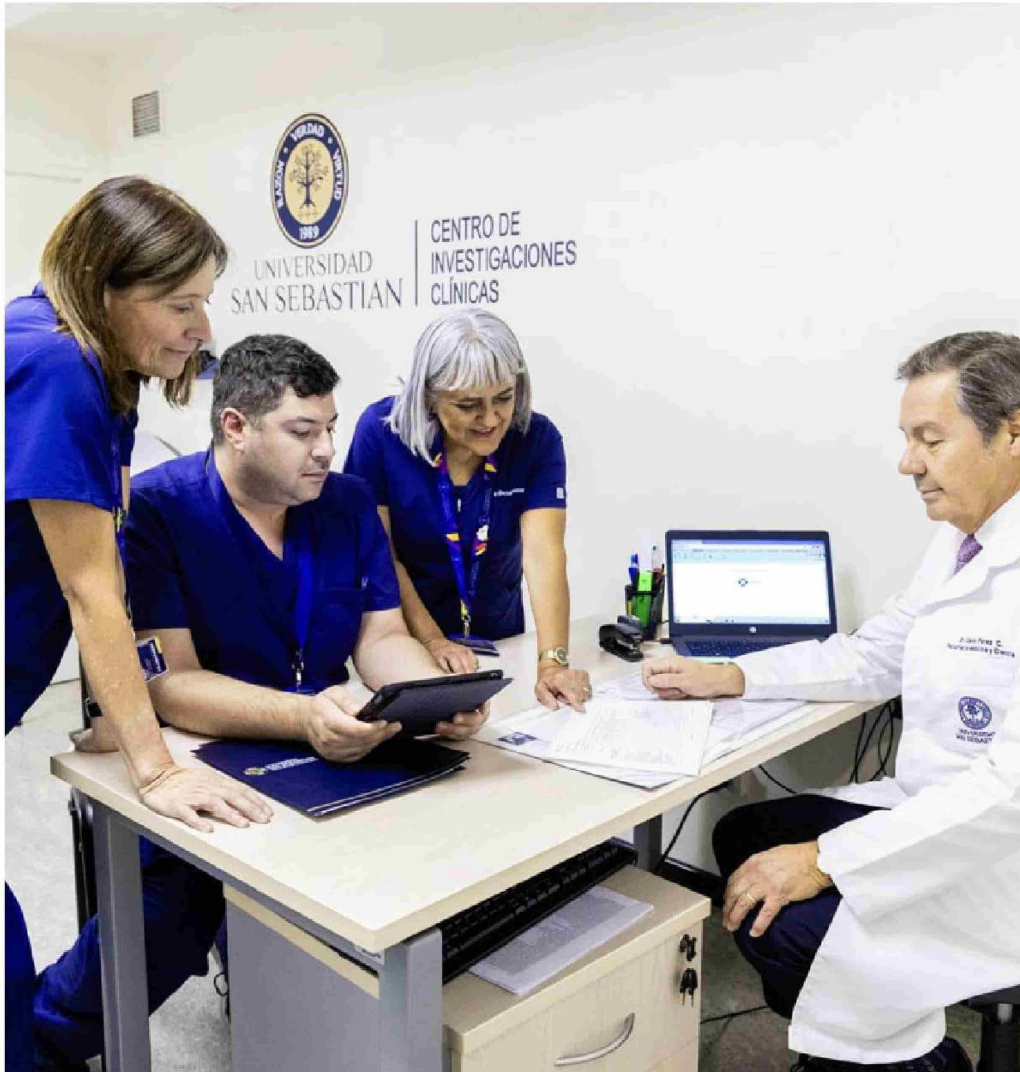
► El estudio se llevará a cabo en el centro CICUSS, en colaboración con el laboratorio francés Sanofi-Pasteur.

Tiraje: 78.224 Lectoría: 253.149 Favorabilidad: No Definida