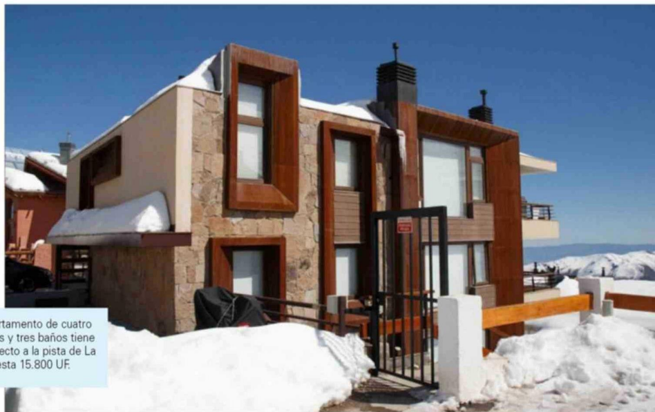
Este departamento de cuatro dormitorios y tres baños tiene acceso directo a la pista de La Parva. Cuesta 15.800 UF.

Las propiedades parten en 5.000 UF, unos $199.274.700, y corresponde a los departamentos más pequeños antiguos y sin remodelar. Los mejor equipados cuestan casi 30.000 UF ($1.195.648.200) y son espacios de 200 metros cuadrados con cuatro dormitorios, calefacción central, dos estacionamientos, en primera línea y con acceso directo a las pistas, cuenta Fajardo.