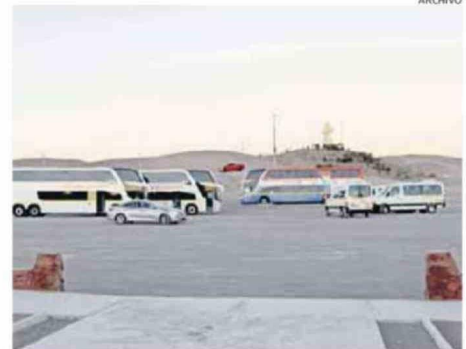
CONCEJALES ACUSAN QUE EMPRESAS NO CUENTAN CON TERMINALES.

“Municipios como el de Caldera, Copiapó e Iquique, plantearon lo mismo tras la visita de Amunochi al Congreso. En este sentido la senadora Yasna Provoste comprometió