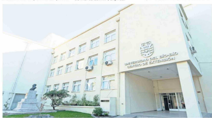
Centro de Extensión UBB en Chillán, actualmente sede de la Dirección de Extensión y otras unidades universitarias.

Prueba de esto es el rol clave que cumple la Universidad del Bio-Bío en la habilitación del Polo de Salud, con el respaldo del Gobierno Regional de Nuble. La apertura de la carrera de Medicina, además de Química y Farmacia, aborda un aspecto que hasta ahora no se desarrollaba en Nuble. Esto, a su vez, abre nuevos desafíos para la habilitación de un Polo Cultural en la joven región, a mediano y largo plazo.