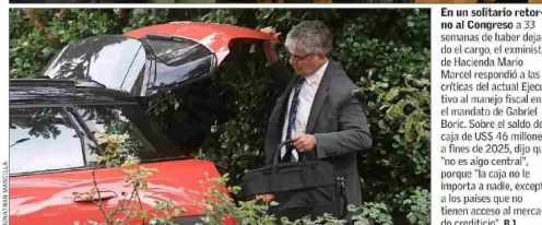
En un solitario retorno al Congreso a 33 semanas de haber dejado el cargo, el exministro de Hacienda Mario Marcel respondió a las críticas del actual Ejecutivo al manejo fiscal en el mandato de Gabriel Boric. Sobre el salto de caja de US$ 46 millones a fines de 2025, dijo que "no es algo central", porque "la caja no le importa a nadie, excepto a los países que no tienen acceso al mercado crediticio". B 1