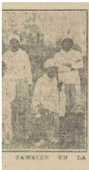
co que da cuenta de las primeras futbolistas organizadas

de un partido. Aspectos que refuerzan el planteamiento respecto a la familiaridad con que el equipo de La Flor de Chile F.C. encaraba un partido de football.