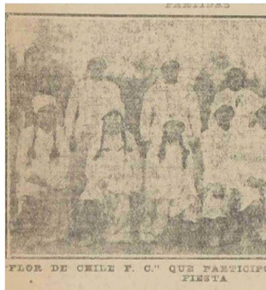
Registro fotográfico del equipo de La Flor de Chile F.C., que participó de la jornada, un registro histórico de nuestro país y de la región latinoamericana. (La Nación, Santiago, 17/06/1919).

La participación de La Flor de Chile F.C. en fiestas deportivas era una costumbre, sus jugadoras y dirigentas mantenían una