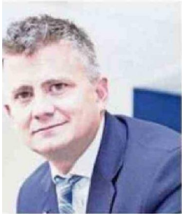
Por Alejandro Urzúa. Analista económico UNAB y OpenBBK

ocurre por decreto; re- confianza y horizonte o plazo.