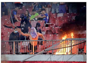
Entre los últimos hechos más graves de violencia se encuentran los destrozos e incendio que provocaron hinchas de Universidad de Chile en el Estadio Nacional en enero pasado.

La Subsecretaría de Seguridad culminó el segundo concurso para proveer el cargo en el Departamento de Orden Público y Eventos Masivos.