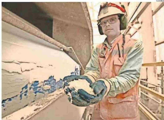
LA COTIZACIÓN DEL LITIO SUPERÓ, DURANTE NOVIEMBRE DEL AÑO 2022, LOS 80.000 DÓLARES LA TONELADA.

El contexto parece auspicioso, pero el ejecutivo de la minera explicó que, si bien los precios promedio reportados