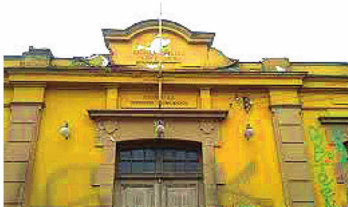
El proyecto de la Escuela Balmaceda tendrá que seguir esperando.