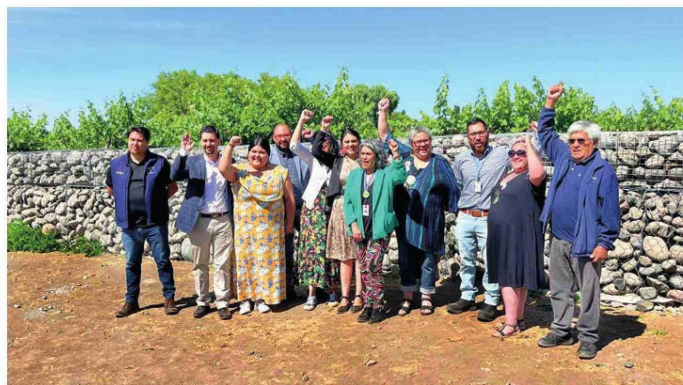
Construcción de pirca de piedra en cementerio Indígena de Tutuquén.

Hubo iniciativas que, por uno u otro motivo, no llegaron a concretarse, mientras que otras sí lo hicieron, aunque su avance fue lento