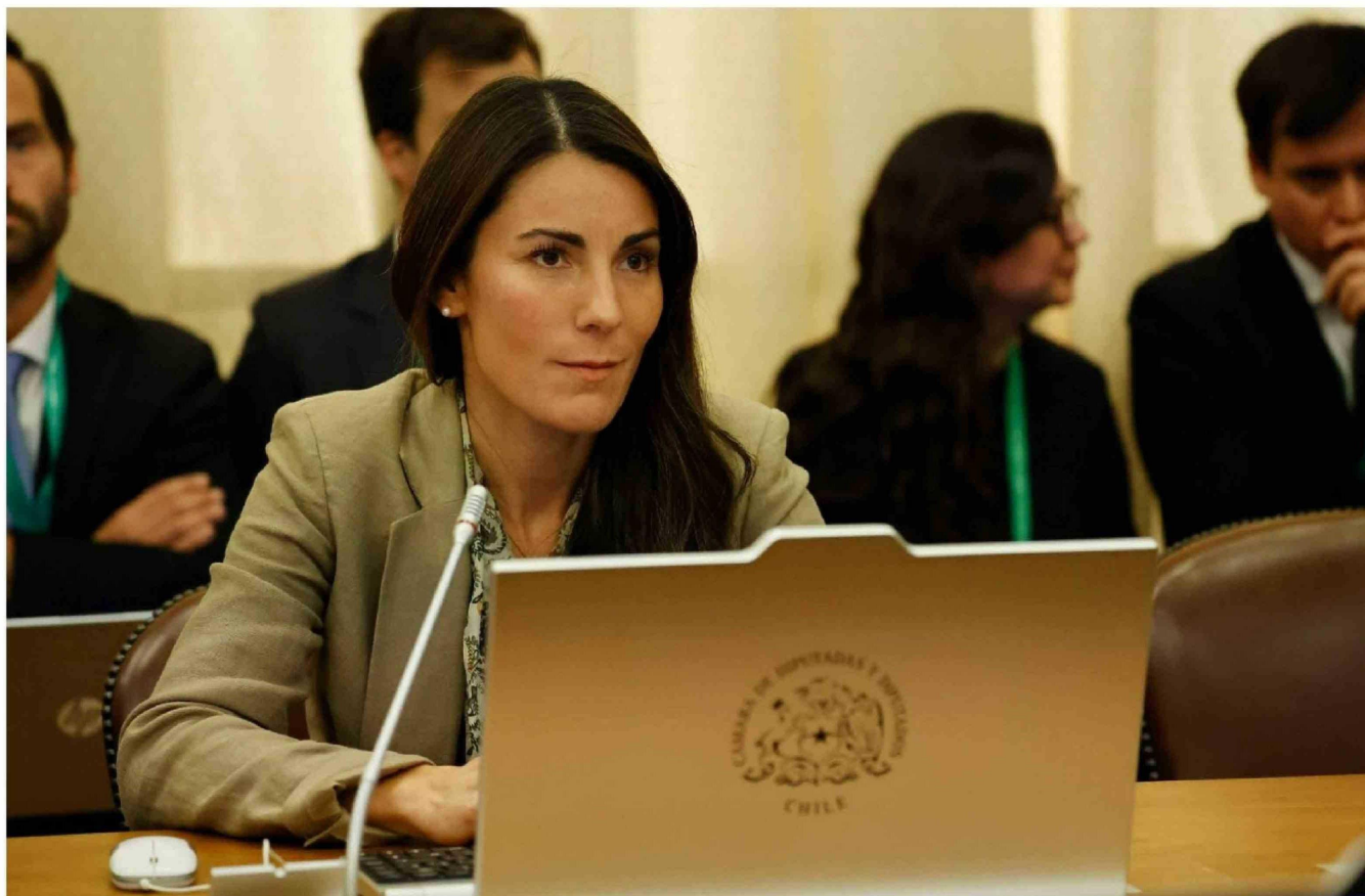
► María Paz Arzola, ministra de Educación, en la Cámara de Diputados.