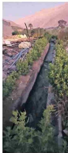
TRAMO EN PAMPA ALGODONAL.