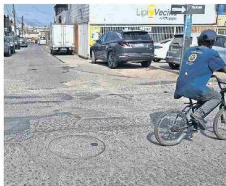
CRÁTERES ABUNDAN EN BERNARDINO GUERRA CON VIÑA DEL MAR.