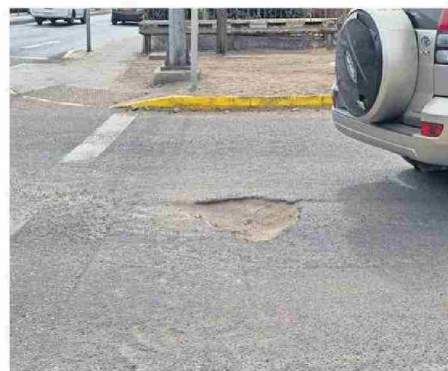
ASÍ LUCE UNO DE LOS ACCESOS AL SECTOR EN CÉSPEDES Y GONZÁLEZ.