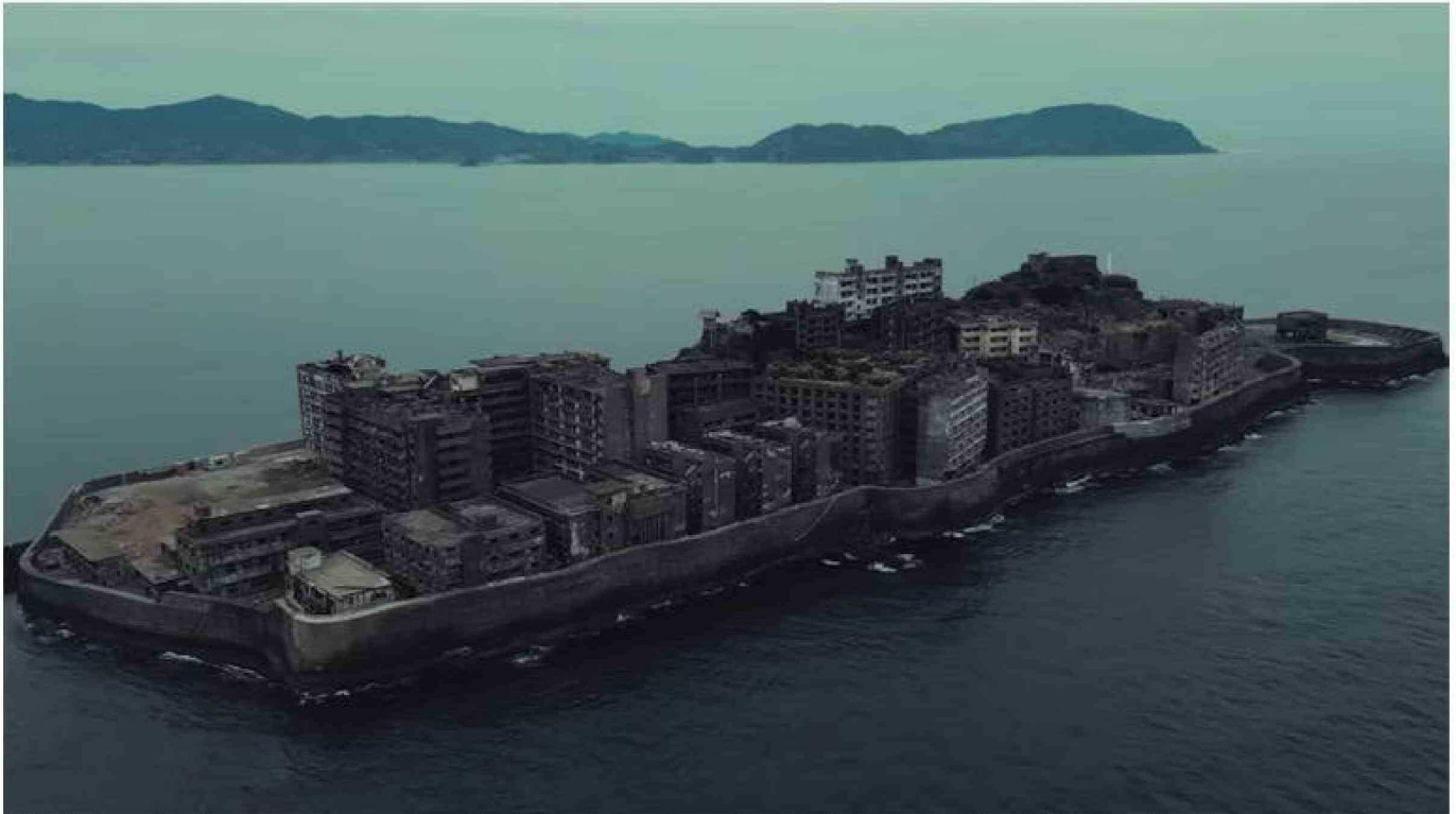
La isla Hashima es ahora famosa por su paisaje apocalíptico y ha sido escenario de series como "Un mundo sin humanos" y de la película James Bond "Skyfall".

En 1930 los edificios sumaban más de treinta a los que se sumaba una casa residencial en el terreno más elevado de Hashima, donde vivía el gerente de la explotación minera.