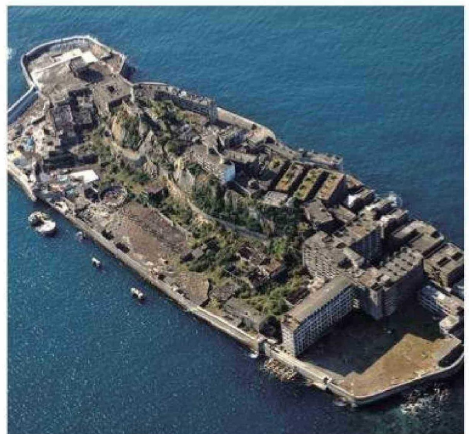
En su apogeo en los años 50, Hashima llegó a albergar a casi seis mil habitantes y numerosos edificios e instalaciones. La decadencia de Hashima comenzó con el agotamiento de la veta de carbón y el auge de la industria petrolera en Japón.