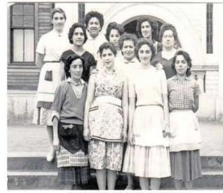
ALUMNAS DE LA DÉCADA DEL '50.