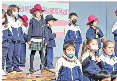
ESTUDIANTES DE TODOS LOS NIVELES FESTEJARON EL CENTENARIO.