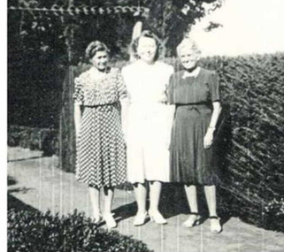
NUMEROSAS MAESTRAS ESTÁN EN ESTA HISTORIA.