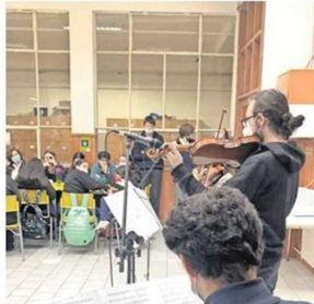
LA MÚSICA ES PARTE DEL PLAN FORMATIVO.