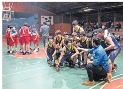
CHICOS Y CHICAS SON EL MOTOR DEL DEPORTE BAUTISTA.