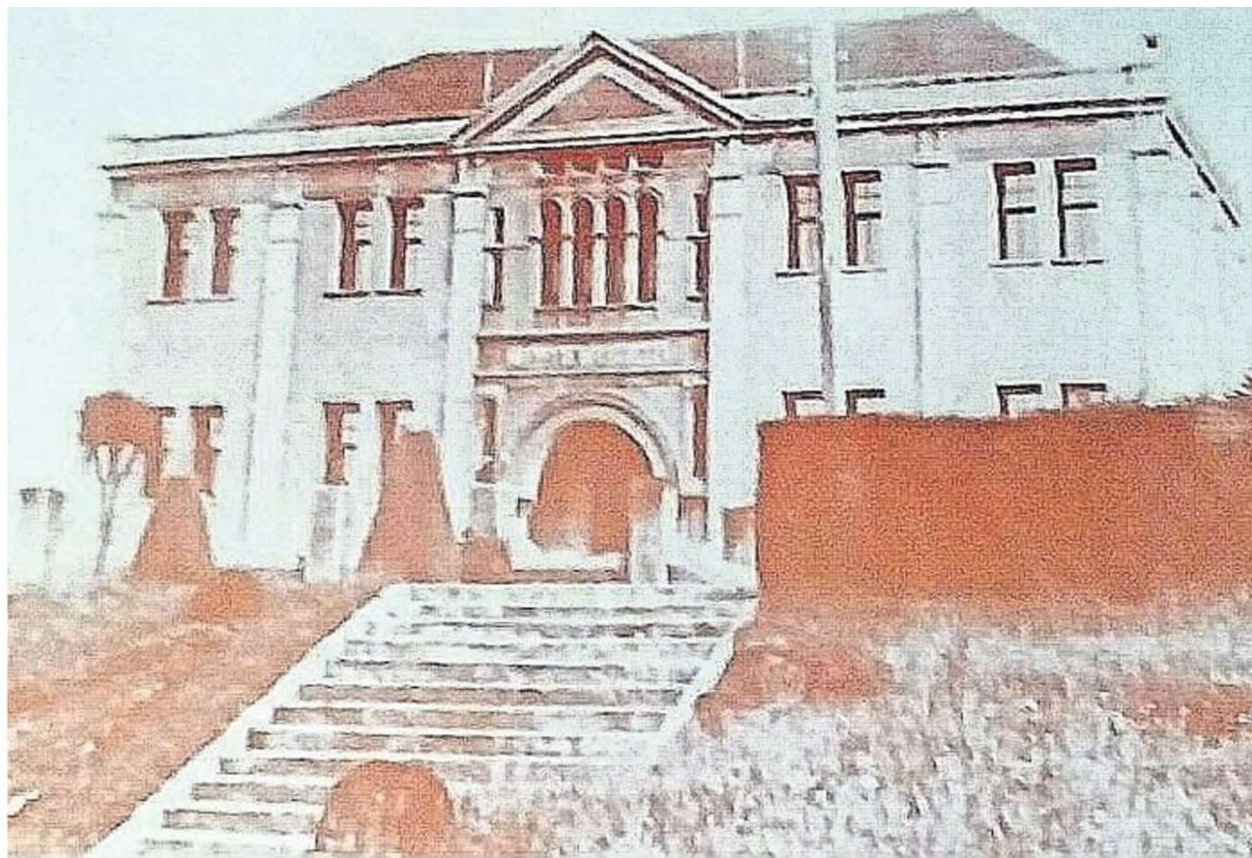
EL AÑO EN QUE TEMUCO INAUGURA LA BIBLIOTECA MUNICIPAL COMIENZA A FUNCIONAR TAMBIÉN EL COLEGIO BAUTISTA, EL CUAL SIEMPRE SE HA MANTENIDO EN EL MISMO PREDIO DONDE COMENZÓ.

Tiraje: 8.000 Lectoría: 16.000 Favorabilidad: No Definida