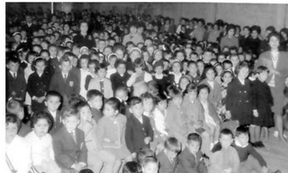
ALUMNOS DEL PASADO ESTUVIERON PRESENTES EN LOS 100 AÑOS.