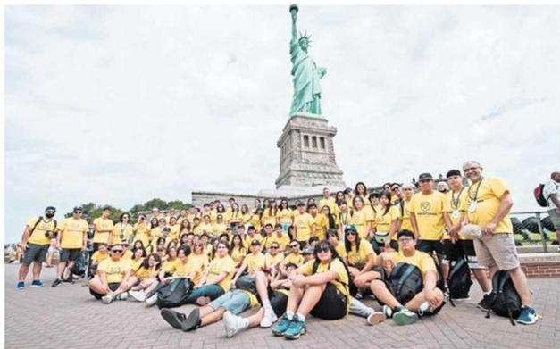
LOS ESTUDIANTES DEL BAUTISTA HAN CRUZAN LAS FRONTERAS ACADÉMICAS AÑO TRAS AÑO.