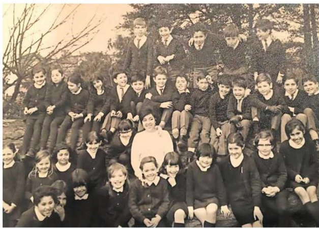
CADA GENERACIÓN HA QUEDADO GUARDADA GRACIAS A LA MAGIA DE LA FOTOGRAFÍA.