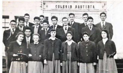
DISTINTAS GENERACIONES HAN PASADO POR EL BAUTISTA DE TEMUCO.