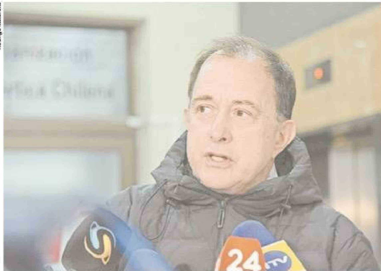
Esperada era la visita del Ministro Poduje a Punta Arenas. Si bien no visitó el sector de la toma en la población Raúl Silva Henríquez, sí expresó su resolución a actuar respecto de ese asentamiento.

Poduje también respondió en Punta Arenas sobre la discusión pública que sostuvo con el Ministerio de Hacienda respecto a los recortes presupuestarios. Aclaró que su postura no fue negarse a recortar, sino definir desde el propio Ministerio de Vivienda dónde hacerlo: