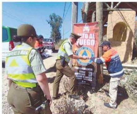
SE PROHIBE REALIZAR ASADOS DURANTE LAS OLAS DE CALOR.