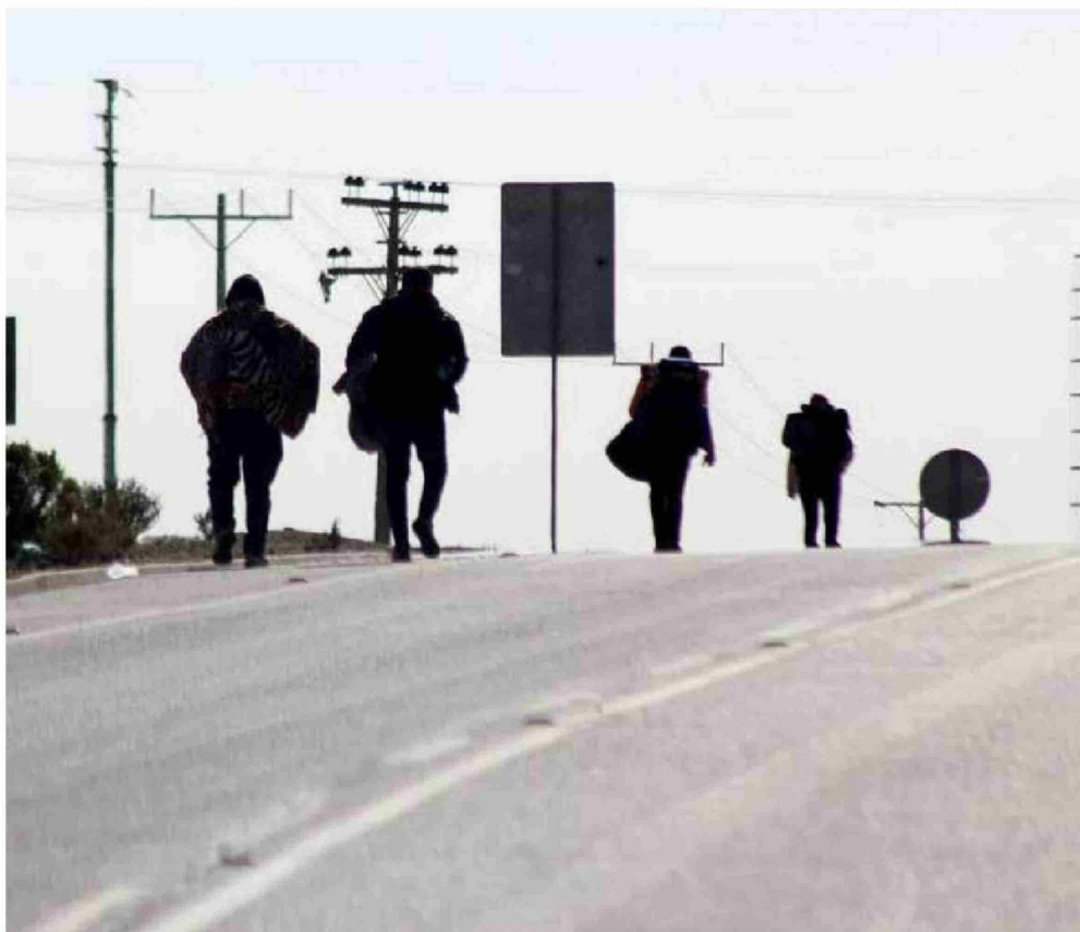
► Uno de los puntos claves del discurso fue el tema de la migración.

alcanzó el peak de homicidios, con 1.330 crímenes. Al año siguiente, la estadística llegó a 1.249 y el 2024 se registraron 1.207 casos, que refleja una caída de 22,8%.