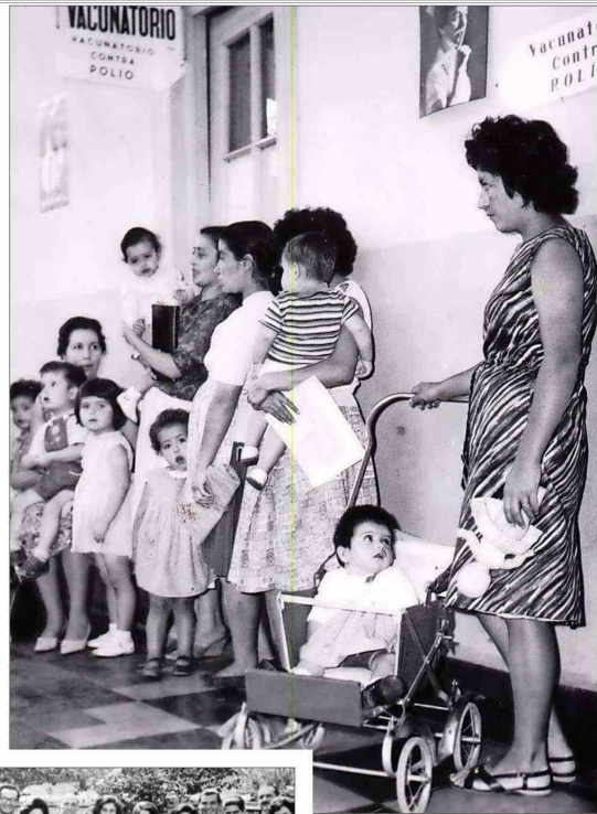
A inicios de los 60, la mortalidad infantil era escalofriante. Estudios señalan que moría más de un tercio de los menores de un año. La imagen es de vacunación contra la poliomielitis (1964).

"Si bien eran solo unas pocas las accedían a la educación superior, su presencia iba en aumento. En 1960, las universitarias eran menos del 3% de la población femenina y en 1970 alcanzaban al 7,1%. Al finalizar la década, las mujeres constituían el 38,3% del total de universitarios. Esta minoría desempeñó un papel simbólico importante al romper con las rígidas divisiones de género que existían entonces. Fueron legitimando la posibilidad de que una mujer quisiera estudiar y trabajar fuera de la casa. Y el proce-