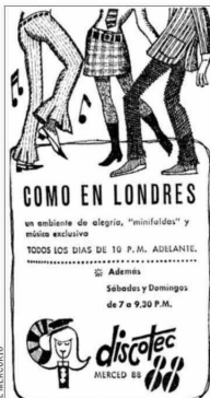
La juventud adquiere gran importancia y atención de los medios. Este aviso de 1967 anuncia "minifaldas y música exclusiva".