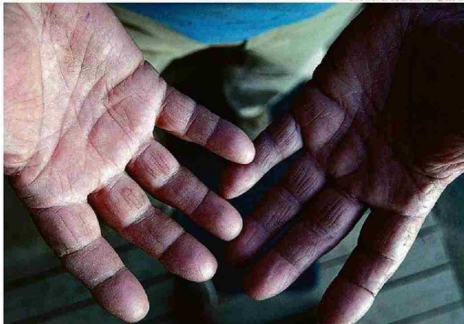
NEURÓLOGO: "ES UNA ENFERMEDAD DEL CEREBRO QUE DIFICULTA LOS MOVIMIENTOS DE LA PERSONA".

"Los fármacos lo que hacen es reemplazar lo que yo he perdido en el área negra, sustancia dopaminérgica que se llama y es como que se van apagando unas lucecitas