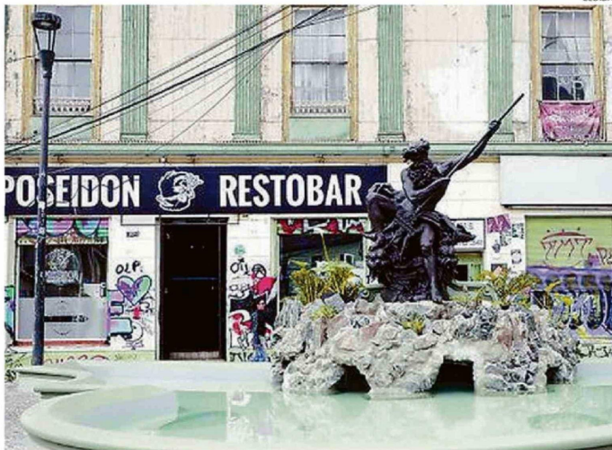
TRES MESES DE TRABAJO LLEVÓ LA RESTAURACIÓN DE LA FUENTE NEPTUNO EN LA PLAZA ANÍBAL PINTO.

En esa línea, el Municipio rectificó la información e hizo énfasis en que el actuar de Seguridad Ciudadana y los uniformados