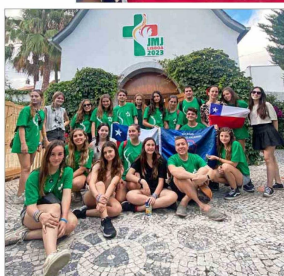
Delegación del Colegio San Miguel Arcángel en el Santuario de Schoenstatt de Lisboa.