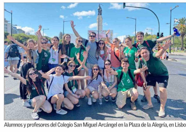
Alumnos y profesores del Colegio San Miguel Arcángel en la Plaza de la Alegria, en Lisboa.