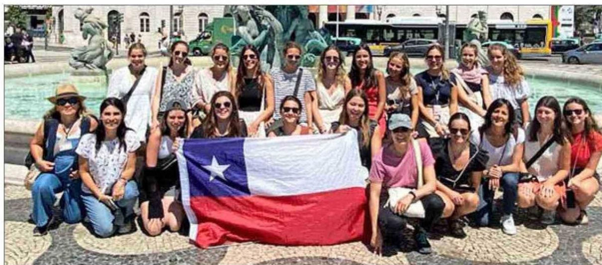
El grupo del Opus Dei, La Fuente, en Lisboa.